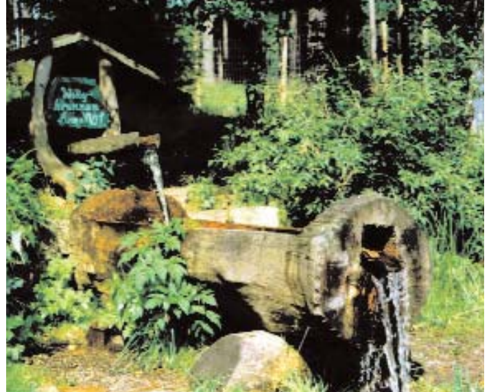
Der „Willybrunnen“ – ein guter Platz für eine Rast beim Wandern

Gewerbegebiet. Seit 2004 gibt es im Ortsteil Walthersdorf auch ein Eisenbahnmuseum zu bestaunen. Viele Vereine sorgen im Ort für ein reges Kulturleben, man kann sich vergnügen und feiern. Im Sommer 2006 fand hier die 600-Jahr-Feier mit vielen Höhepunkten statt. Wer neugierig geworden ist, sollte Crottendorf und seine Umgebung selbst entdecken. Es laden gemütliche Gaststätten zum Speisen und zahlreiche Privatvermieter oder Pensionen zum Besuch ein.